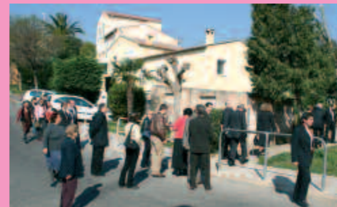
Inauguration : réhabilitation "Les Salamandres / Pivoines"

Une fois l'inauguration passée, c'est en effet le temps pour nos nouveaux locataires de s'approprier les lieux et de les faire vivre. Retour en image sur les inaugurations du 16 mars dernier.