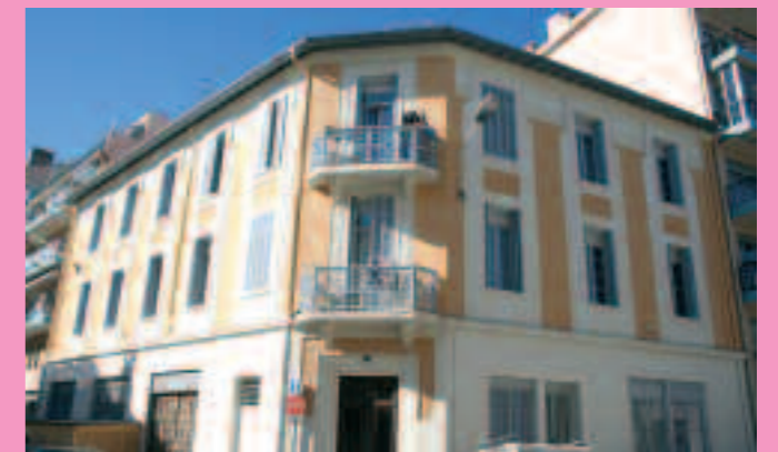
Inauguration : réhabilitation "L'Aubier"