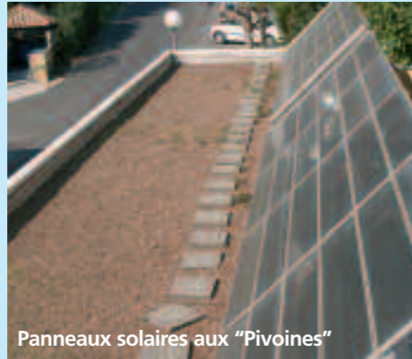
Panneaux solaires aux "Pivoines"

Il existe aujourd'hui plusieurs sources d'énergies : les traditionnelles (électricité, gaz, etc.) et les renouvelables (solaire, éoliennes, bois, etc.). L'Office s'est engagé depuis de nombreuses années dans une politique de maîtrise énergétique volontariste, dans le but de participer à la protection de l'environnement mais aussi de diminuer les charges de ses locataires.