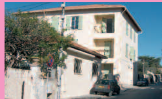
Inauguration : réhabilitation "Les Loggias"