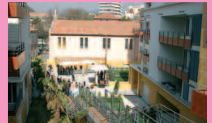
Inauguration de la construction "Le Prado"